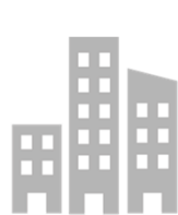
企業 (従業員を使用)