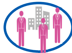
消費者・企業 (不特定多数)