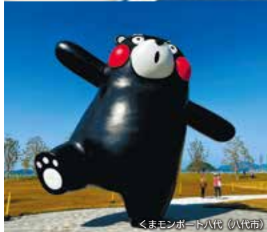
くまモンポード八代 (八代市)