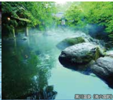
黒川温泉 (南小国町)