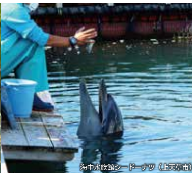
海中水族館シーダーナツ (上天草市)